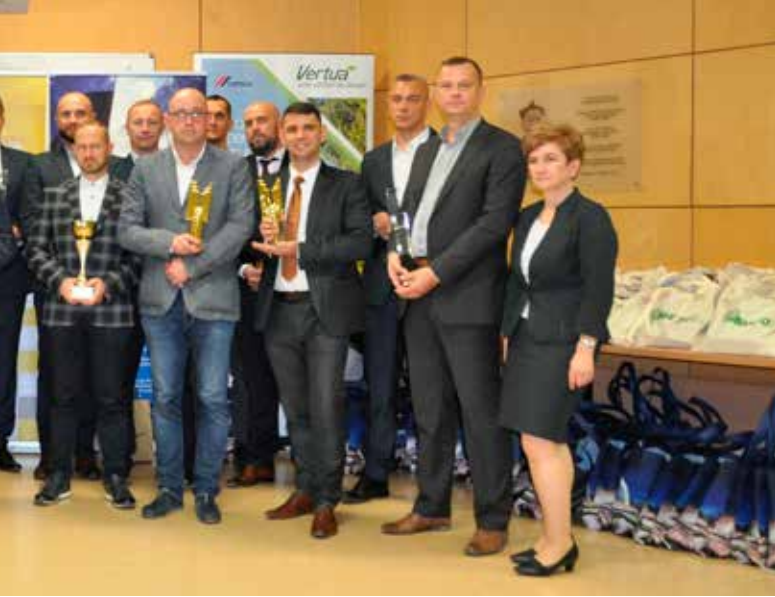
w regionie północno-wschodnim

studenckich, a potem ci studenci odbierają bardzo prestiżowe nagrody za swoje realizacje.