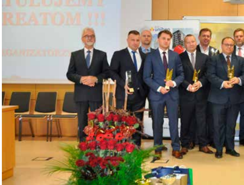
Pamiątkowe zdjęcie laureatów prestiżowego konkursu Budowa Roku 2019-2020

W tym roku, już po raz 26 poznaliśmy najpiękniejsze, najbezpieczniejsze, najnowocześniejsze i najlepiej zbudowane obiekty w naszym regionie. Gala `2021 była wyjątkowa. Wyjątkowa, bo zgłoszono do niej aż 14 obiektów. A do tego realizacjami wszystkich lub prawie wszystkich tych znamienitych obiektów kierowali absolwenci Politechniki Białostockiej. Bo trzeba dodać, iż tegoroczna edycja konkursu odbyła się w ramach obchodów Jubileuszu 70-lecia Wydziału Budownictwa i Nauk o Środowisku PB.